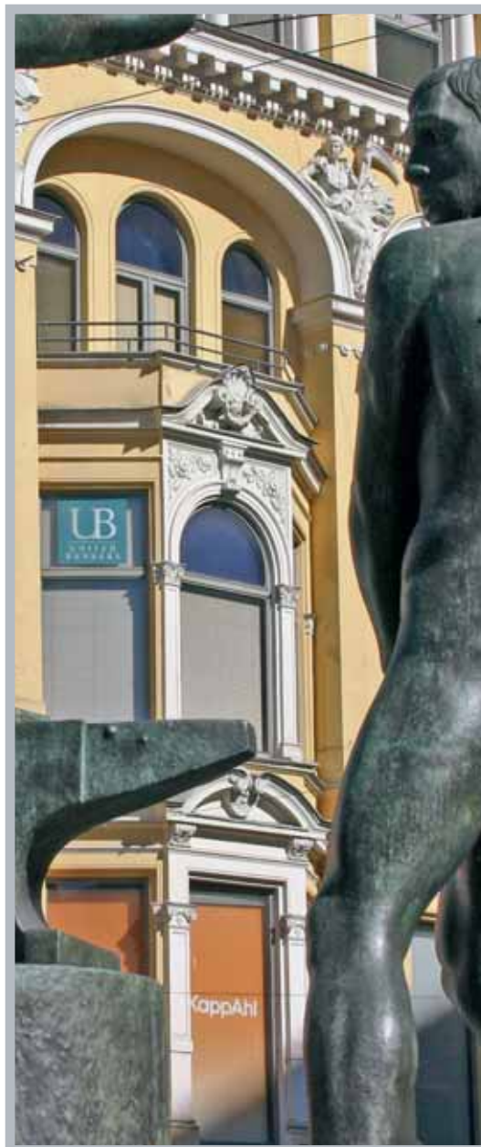
United Bankers sijaitsee keskeisellä paikalla Helsingin Aleksanterinkadulla.

Osakeindeksin tai -indeksikorin tuotto lasketaan normaalisti keskiarvona useammasta havainnosta ennen lainan erääntymistä. Sijoittajan saamaan tuottoon vaikuttaa myös indeksilainan tuottokerroin. Korkeampi tuottokerroin antaa kohdeindeksien noustessa sijoittajalle paremman tuoton.