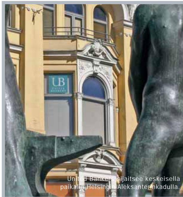
United Bankers' sijaitsee keskeisellä paikalla Helsingin Aleksanterinkadulla.

Ostaessaan tämän osakeindeksilainan sijoittaja ottaa Handelsbanken-luottoriskin. Handelsbankenin kansainvälinen vakavaraisuusluokitus on yksi pohjoismaisten liikepankkien korkeimmista; Moody's Aa1 ja Standard & Poors AA- (marraskuu 2007). Lainalle ei ole asetettu muuta vakuutta.